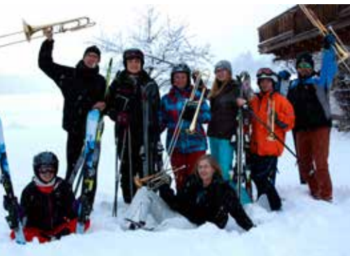
Skifreizeit 2016 - 2017