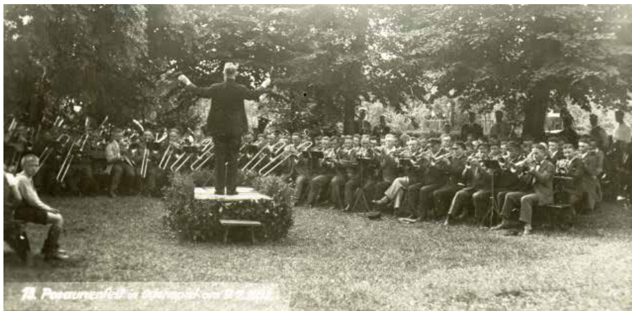
Posaunenfest in Odenspiel 1933