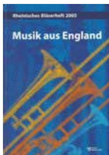
Bläserheft von 2005 - der Start der beliebten Reihe

Das erste Kapitel stellt große französische Komponisten von Josquin des Pres über Marc Antoine Charpentier, Cesar Franck, Alexandre Guilmant bis hin zu Maurice Ravel vor.