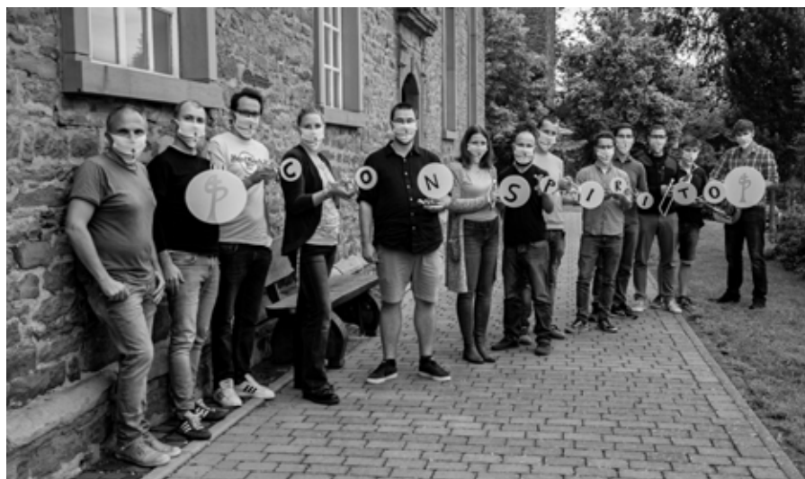
Con Spirito - coronaabwehrbereit

mäßig wiederzugeben mit einer Auswahl von Chansonvertonungen und bekannten Filmmelodien.