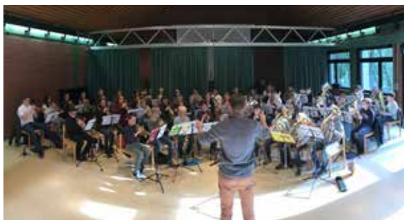
Auf der Kranenburg in 2017