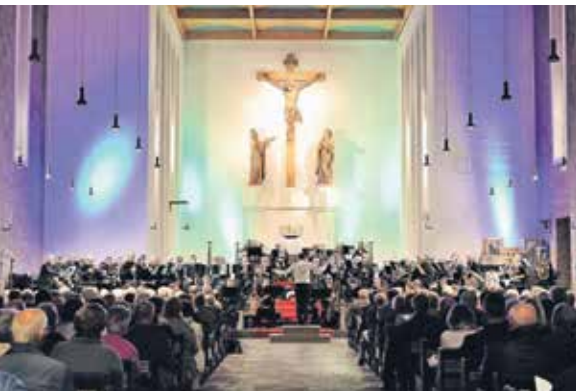
Bläser- und Orgelkonzert beim IDO-Festival 2018

Das Internationale Düsseldorf Orgelfestival war in den letzten Jahren auch für unser Werk ein fester Bestandteil im Jahreskalender. Viele erinnern sich an die großartigen Bläser- und Orgelkonzerte zur Eröffnung des Festivals. Solche Bilder wie etwa 2018 (siehe oben) mit sehr vielen Teilnehmern und Zuschauern wird es aber in diesem Jahr nicht geben können.