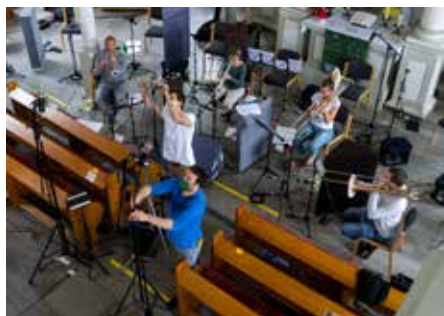
Bei den Aufnahmen für die Bläser-CD.

Das Abschlusskapitel versucht die französische Lebensart stimmungs-